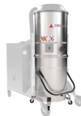
GX Cámara y contenedor en acero INOX AISI 304á