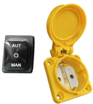
RC SCHUKO Control remoto desde herramientas eléctricas (MAX 2000 W)