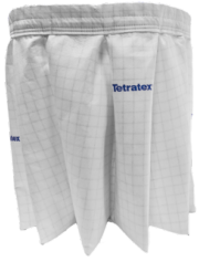
PTFE ANT Filtro antiestático PTFE (M clase EN 60335-2-69)