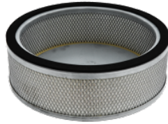
HEPA 14 Filtro absoluto (EN 1822) 22.000 cm 2 superficie filtrante Filtro antiestático clase H14 (EN 1822) Fibra de vidrio