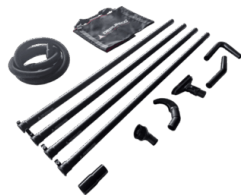
P14900 VERTIVAC – LEITFÄHIGES ZUBEHÖRSET FÜR REINIGUNGSARBEITEN IN DER HÖHE Ø 40 MM