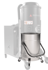
BX Edelstahl Behälter AISI 304 (V2A)