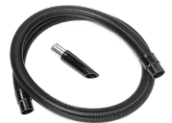
P12378 KIT STARTER ANTISTATIC Ø 50MM Kit antistatic, de accesorii de baza pentru aspiratoarele ATEX, diametru de 50 mm