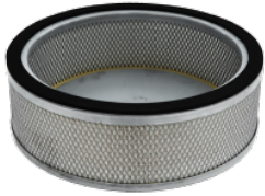
HEPA 14 Filtru absolut (EN 1822) 22.000 cm 2 filter surface H14 Class Filter (EN 1822) Glass fiber