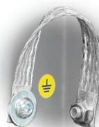
GRD Mise à la terre