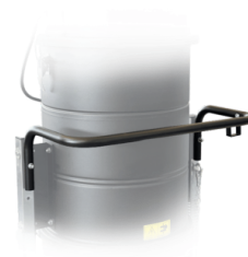
POIGNÉE DE POUSSÉE