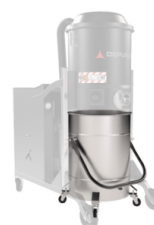
BX Edelstahl Behälter AISI 304 (V2A)