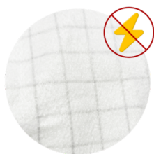
ANTISTATISCHE FILTERUNG Antistatische Filterung zur Ableitung statischer Energie