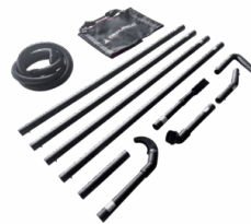
P14901/EX VERTIDEX – ATEX-ZERTIFIZIERTES ZUBEHÖRSET FÜR REINIGUNGSARBEITEN IN DER HÖHE Ø 40 MM