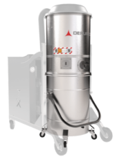
GX Edelstahl Behälter AISI 304 (V2A) und Gehäuse