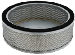
HEPA 14 Absolutfilter (EN 1822) 22.000 cm 2 Filterfläche Antistatischer H14 Klasse Filter (EN 1822) Glasfaser