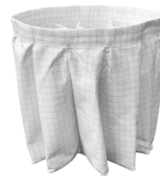
ANT M Antistatischer Filter (M Klasse EN 60335-2-69)