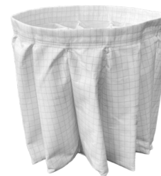
ANT M Antistatischer Filter (M Klasse EN 60335-2-69)