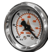
VAKUUMMETER Vakuummeter zur Signalisierung, wenn der Filter verstopft ist oder ausgetauscht werden muss