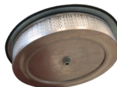
HEPA 14 Absolutfilter (EN 1822-5)