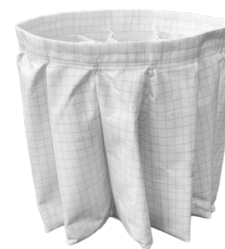
ANT M Antistatischer Filter (M Klasse EN 60335-2-69)