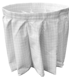
ANT M Antistatischer Filter (M Klasse EN 60335-2-69)