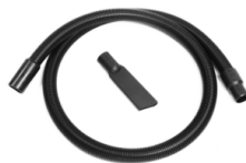
ZUBEHÖR-KITS P13641 Grundausrüstung an antistatischem Zubehör - 40 mm