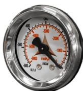
VAKUUMMETER Vakuummeter zur Signalisierung, wenn der Filter verstopft ist oder ausgetauscht werden muss