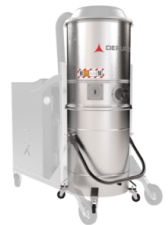
GX Edelstahl Behälter AISI 304 (V2A) und Gehäuse