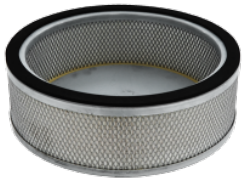
HEPA 14 Absolutfilter (EN 1822) 22.000 cm 2 Filterfläche Antistatischer H14 Klasse Filter (EN 1822) Glasfaser