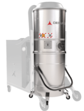
GX Edelstahl Behälter AISI 304 (V2A) und Gehäuse