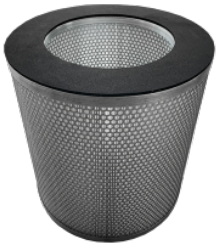
HEPA 14 Absolutfilter (EN 1822) 110.000 cm 2 Filterfläche Antistatischer H14 Klasse Filter (EN 1822) Glasfaser