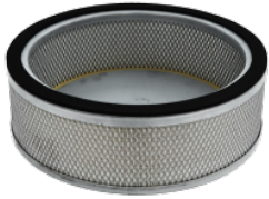
HEPA 14 Filtre absolu (EN 1822) 22.000 cm 2 surface filtrante Filtre antistatique classe H14 (EN 1822) Fibres de verre